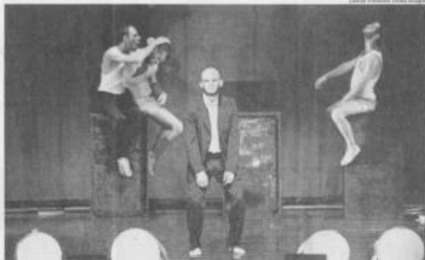
Cena do espetáculo "Primus", interpretado pelo grupo Boa Companhia, que participa do FTC